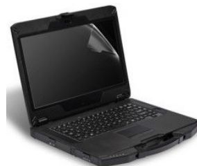
Защитная пленка на экран