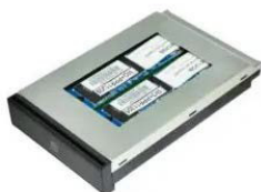
Быстросъемная корзина с SSD накопителем