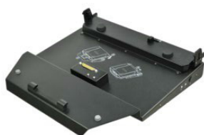
Док-станция для офиса