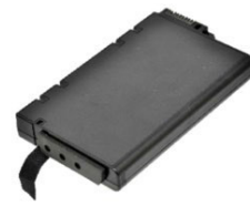
Запасная основная батарея